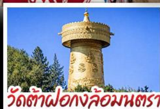
วัดต้าฝอ กงล้อมณฑล