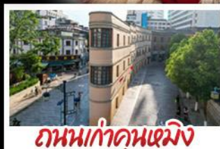
ถนนเก่าคุณหมิง