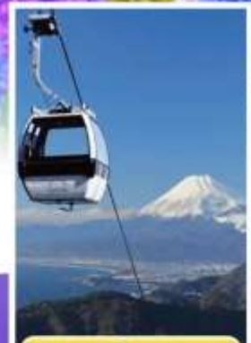
อิซุพานรามาวิว

ออนเซ็น 1 คั้น นน.กระบ่า 23 กก. 7Days 4Night