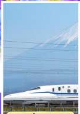
สัมพัสนั่งชินคันเซน