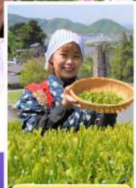
กิจกรรมเก็บชาเขียว