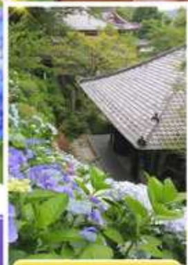
วัดฮาเซเดระ