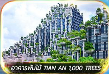
อาคารพินไม TIAN AN 1,000 TREES