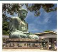
วัดโศโตคุอิน

SHIRAKAWAGO JAPAN ALPS MATSUMOTO KAMIKOCHI FUJI KAMAKURA