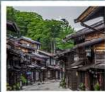
หมู่บ้านโบราณนารายิ จุกุ