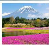
ทะเลสาบโมโตสุ ทุ่งพืชมอส