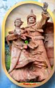
เมืองโบราณซงฟา