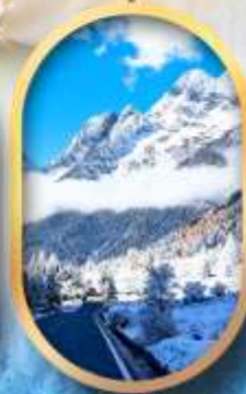
อุทยานสี่ครุณี