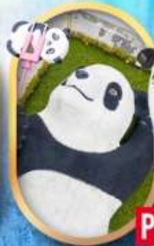
แพนด้าเซลฟี