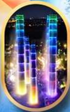
SKP Global Center