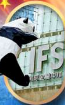
IFS หมีแพนด้าป็นตึก