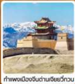
กำแพงเมืองจีนด่านเจี๋ยวี่กวน