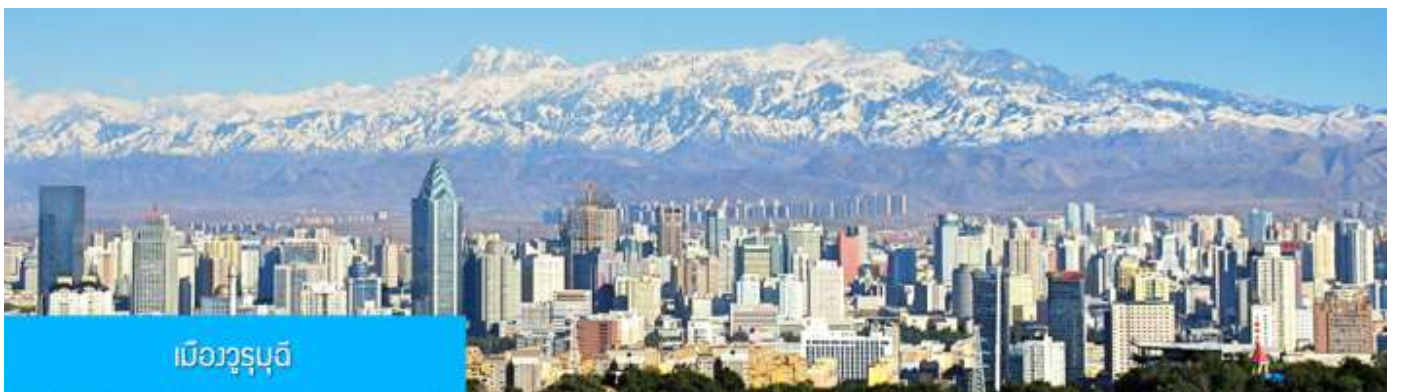
เมืองูรูมูฉี