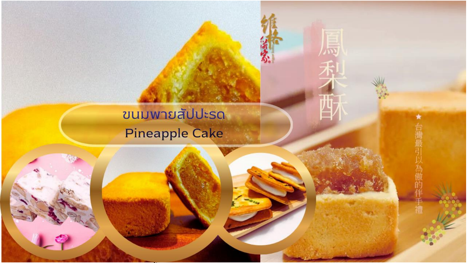
ขนมพายสับปะรด Pineapple Cake

นำท่านเดินทางสู่แหล่งช้อปปิ้งที่มีชื่อเสียงมากที่สุด เป็นที่นิยมมากที่สุดในไต้หวัน คือ ซีเหมินติง Ximending หรือที่คนไทยเรียกว่า สยามสแควร์เมืองไทย มีทั้งแหล่งเสื้อผ้าแบรนด์เนม สไตลว์วัยรุ่น กระเป๋า รองเท้ายี่ห้อดังต่างๆ ระดับโลก รวมทั้งมี ชานมไข่มุก ร้านอาหารแสนอร่อยให้ชิมอย่างมากมาย และยังมีร้าน ART TOY ชื่อดังที่กำลังเป็นกระแสอยู่ในขณะนี้ POP MART ซึ่งเป็นสาขาที่ใหญ่ที่สุดในไต้หวัน ตั้งอยู่ในใจกลางซีเหมินติง ให้ท่านได้ เลือกซื้อ ตุ๊กตา อาทิเช่น LABUBU, MOLLY, CRYBABY, SKULLPANDA, DIMOO, HIRONO และอื่นๆ อีกมากมาย