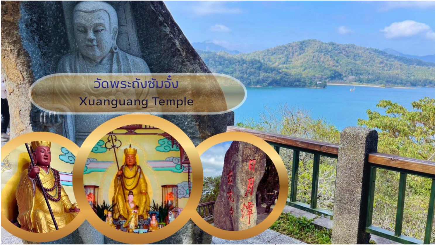
วัดพระถังซำจั๋ง Xuanguang Temple

นำท่านเดินทางสู่ วัดเหวินหวู่ Wenwu Temple หรือ วัดกวนอู ตั้งอยู่ระหว่างเขาทางทิศเหนือของทะเลสาบสุริยันจันทรา สร้างขึ้นเมื่อปี ค.ศ. 1938 ภายในวัดมีรูปปั้นของซ่งจื้อและเทพกวนอู (เทพเจ้าแห่งปัญญา และเทพเจ้าแห่งความซื่อสัตย์) ซึ่งชาวไต้หวันเชื่อกันว่า หากได้บูชาเทพเจ้ากวนอู จะได้ประสบความสำเร็จในหน้าที่การงาน มีแต่คนจงรักภักดี หรือหากวางแผนสิ่งใด ก็จะได้ประสบความสำเร็จตามปรารถนา เป็นวัดศักดิ์สิทธิ์อีกแห่งหนึ่งของไต้หวัน แต่เดิมในอดีตริมฝั่งทะเลสาบสุริยันจันทราเป็นที่ตั้งของ 2 วัดเก่า คือวัดหลงฟิง Longfeng Temple และวัดหัวถั่ง Huatang of Shuishotsun ชาวบ้านกล่าวว่าน้ำจากทะเลสาบสุริยันจันทรา จะทะลักเข้ามาท่วมวัดหลงฟิงและวัดหัวถั่ง จึงสร้างวัดเหวินหวู่ขึ้น แล้วรวมวัดทั้งสองแห่งไว้ในวัดเหวินหวู่เพียงแห่งเดียว และสร้างกำแพงให้แข็งแรงยิ่งขึ้น เพื่อรับมือกับน้ำจากทะเลสาบสุริยันจันทราที่หนุนขึ้นสูง ในปัจจุบัน สถาปัตยกรรมของวัดนี้เต็มไปด้วยงานแกะสลักหินจำนวนมาก รวมถึงสิงโตหินอ่อน 2 ตัว ที่ตั้งอยู่บริเวณด้านหน้าของวัดซึ่งมีมูลค่าตัวละ 1 ล้านบาทโดยตัววิหารใหญ่แบ่งออกเป็นสามชั้นและมีวิหารเล็กโอบล้อมอยู่ด้านข้าง และเป็นจุดชมวิวที่สวยงามอีกแห่งหนึ่งของทะเลสาบสุริยันจันทราอีกด้วย