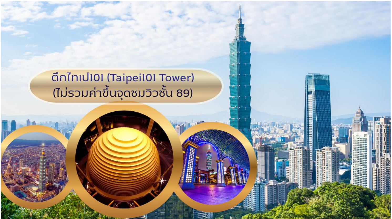
ตึกไทเป101 (Taipei101 Tower) (ไม่รวมค่าขึ้นจุดชมวิวชั้น 89)

อดีตยังคงสูงที่สุดในโลก ตึกไทเป 101 ยังคงความเป็นที่ 1 ไปได้คือลิฟต์ที่เร็วที่สุดในโลก ใช้เวลาขึ้นถึงชั้น 89 เพียงแค่ 37 วินาทีเท่านั้น (ไม่รวมค่าขึ้นจุดชมวิวชั้น 89) ** ท่านสามารถเลือกซื้อ Optional บัตรชม ตึกไทเป 101 วิวชั้น 89 ผ่านทางบริษัททัวร์ กรุณาแจ้งความประสงค์ ณ วันจองทัวร์ หรือแจ้งล่วงหน้าก่อนการเดินทางก่อนเดินทางอย่างน้อย 7 วันทำการ**