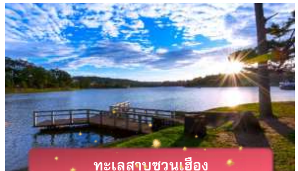
ทะเลสาบชวนเอื้อง

ที่พัก The Western Hill ระดับ 4 ดาวหรือเทียบเท่า