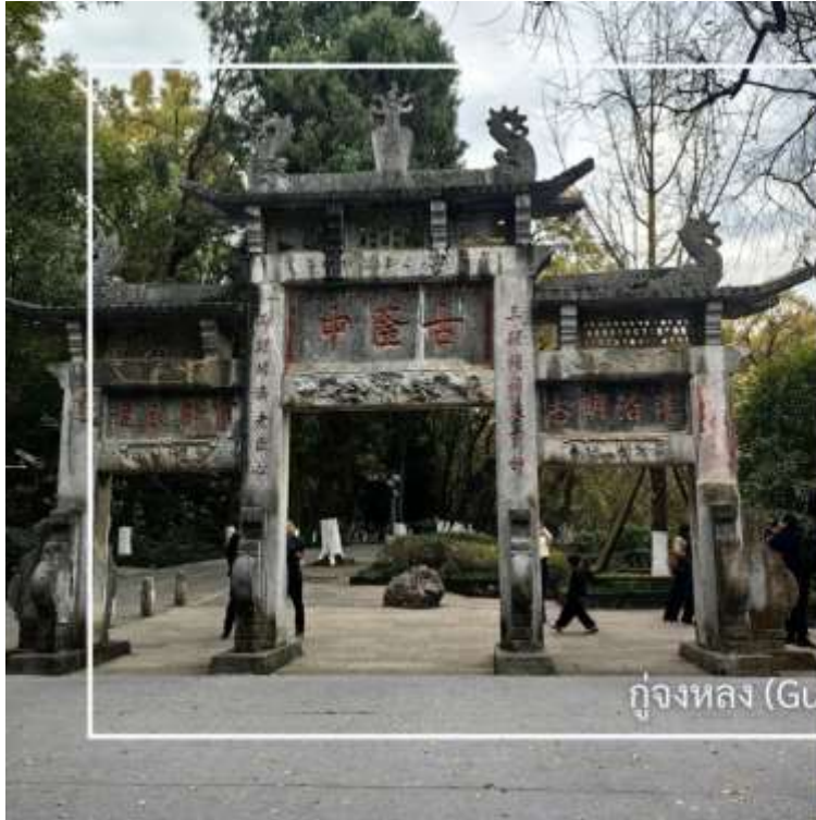
กุหลองจง (Gulongzhong)

หลังอาหารเช้านำท่านสู่ กุหลองจง (Gulongzhong) แหล่งท่องเที่ยวทางประวัติศาสตร์และวัฒนธรรมที่มีชื่อเสียง ตั้งอยู่ใกล้เมืองเซียงหยาง เป็นสถานที่พำนักของ จูกัดเหลียง (ซงเบ้ง) นักปราชญ์และนักยุทธศาสตร์ผู้ยิ่งใหญ่แห่งยุคสามก๊ก สถานที่แห่งนี้ในอดีตคือสถานที่ที่เล่าปี่ได้เดินทางมาพบกับจูกัดเหลียงที่เชิญตัวไปร่วมทัพ ปัจจุบันสถานที่นี้โอบล้อมด้วยธรรมชาติ สะท้อนบรรยากาศแห่งการศึกษา และวางแผนการเมืองในอดีต พร้อมให้ท่านได้เรียนรู้เรื่องราวทางประวัติศาสตร์อันทรงคุณค่า พร้อมสัมผัสบรรยากาศที่เชื่อมโยงกับตำนานและภูมิปัญญาจีนโบราณ จึงนับเป็นจุดหมายสำคัญสำหรับผู้ที่สนใจประวัติศาสตร์ยุคสามก๊ก และวัฒนธรรมจีน