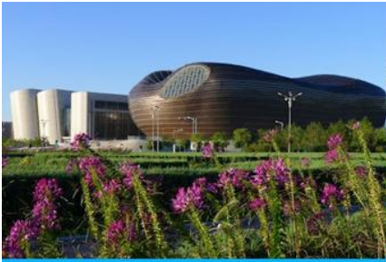
อุทยานคังปาสื่อ