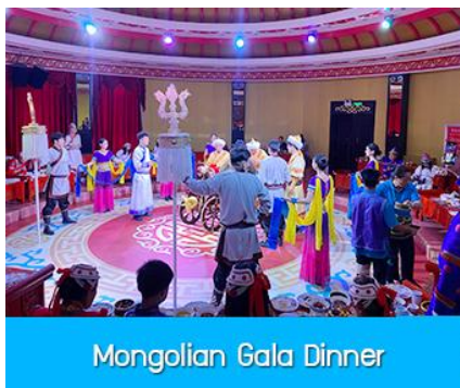
Mongolian Gala Dinner

那达慕 Naadam Festival หรือเทศกาลเฉลิมฉลองที่คล้ายวันตรุษจีนของชาวจีน ประกอบด้วยกิจกรรมการเล่นพื้นเมืองแบบมองโกล รวม 22 อย่าง ได้แก่ พิธีแต่งงานเออร์คอส / การขี่ม้าในสนาม / ปาร์ตี้รอบกองไฟ / ขี่ม้าถ่ายรูป / สไลเดอร์หญ้า / รถลางทุ่งหญ้า / สวนแขวงกต/สวนเด็กเล่น / ตีกอล์ฟทุ่งหญ้า / รถบังคับ / รถโกคาร์ต / โยนบอลทุ่งหญ้า / ปืนไฟมองโกล / ยิงธนูในร่ม / แข่งขันจับแกะ / คล้องม้าจำลอง / หมูเลี้ยงน้ำเอ็นดู / เครื่องเล่นหมุน / เลี้ยงแกะโยน / ยิงธนู / ทอยแจกัน / เซ็นต์ชื่อภาษา มองโกล ให้เลือกเล่นได้ 12 อย่างตามรายการที่ระบุ.....อัตราค่าบริการสำหรับ 那达慕 Naadam Festival 380 หยวน หรือ 1,900 บาท/ท่าน (สำหรับลูกค้าทัวร์ที่ไม่ซื้อโปรแกรมเสริม สามารถเดินเล่น ถ่ายรูปบริเวณทุ่งหญ้าหรือพักผ่อนตามอัธยาศัย)