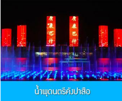
น้ำพุดนตรีคังปาสือ

จากนั้นนำท่านเดินทางกลับสู่ เมืองเออร์ดอส 鄂尔多斯 (ระยะทาง 180 กิโลเมตรใช้เวลาประมาณ 3 ชั่วโมง ) รับประทานอาหารค่ำ ณ ภัตตาคาร (9)