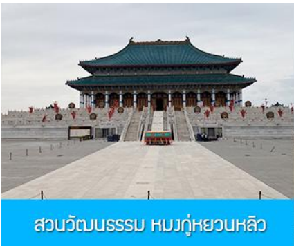
สวนวัฒนธรรมหมงกู่หยวนหลิว

พักที่ ORDOS BOYU AIRUI HOTEL โรงแรมระดับ 4 ดาวท้องถิ่น หรือเทียบเท่าในเมืองเออร์ดอส