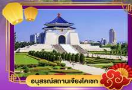
อนุสรณ์สถานเจียงไคเชก