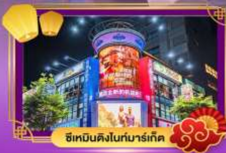
ซีเหมินดิงไนท์มาร์เก็ต