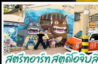
สตรีทอาร์ต สตูดิโอจิบลิ