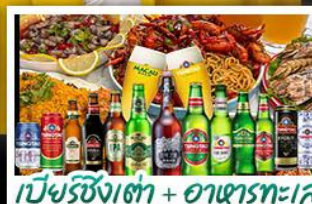
เบียร์ซิงเต่า + อาหารทะเล