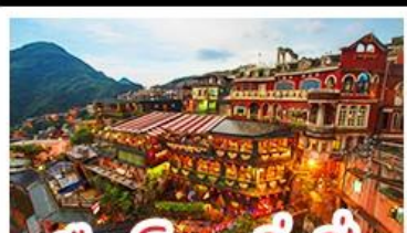
เมืองโบราณจีวเฟิน

เที่ยวธรรมชาติระดับโลก เอเชีย ทะเลสาบสุริยันจันทรา - เมืองดงครบ ไทเป จีวเฟิน - ซีเหมินติง