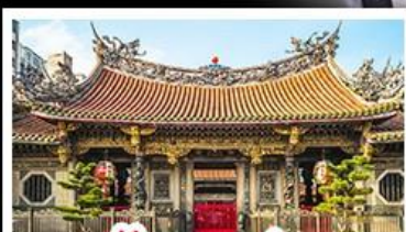
วัดเจหลงซาน