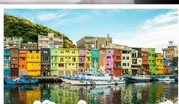
หมู่บ้านประมงเหลากสี