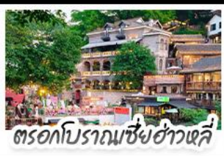
ตรอกโบราณเขี่ยฮ่าวหลี่