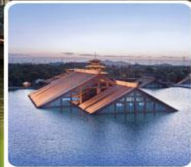
พิพิธภัณฑ์ไต้บน้ำ กวางฟู่หลิน