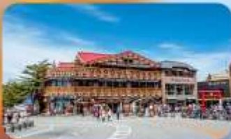
ภูเขาไฟฟูจิ ชั้นที่ 5