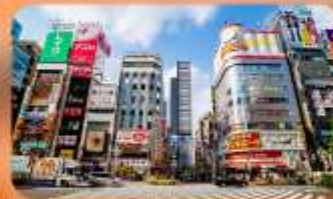
ซ้อปปิ้งชินจูกุ