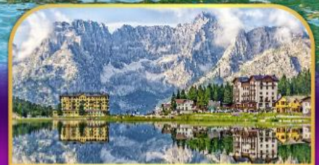
ทะเลสาบมิสุรีนา