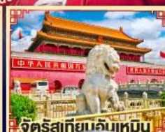
จัตุรัสเทียนจันเหมิน