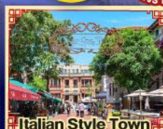
Italian Style Town