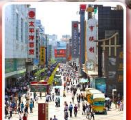
ช้อปปิ้งถนนคนเดินซุนซีลู่