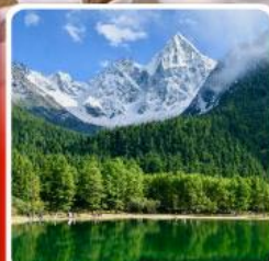
อุทยานπίงเิงโกว