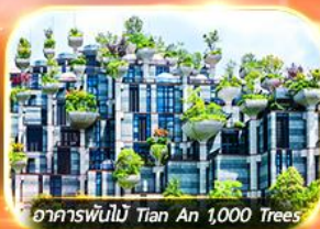
อาคารพันไม้ Tian An 1,000 Trees