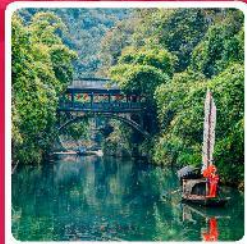
หมู่บ้านชานเสี่ยเหรินเจีย

ไฮไลท์! อุทยานเขานางฟ้า อุทยานหลุมฟ้า 3 สะพานสวรรค์ นั่งรถไฟความเร็วสูง หงหยาดัง สวนถ้ำสามสหาย