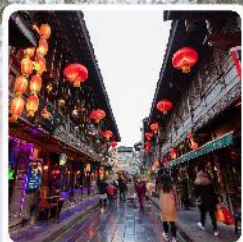
ถนนโบราณจีนหลี่