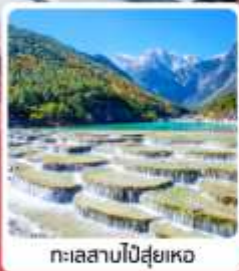
ทะเลสาบโป้สุ่ยเหอ