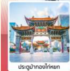
ประตูน้ำทองโก่หยก