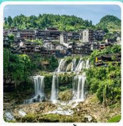
ฟูหรงเจิน