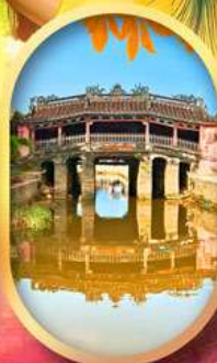
เมืองเก่าฮอยอัน