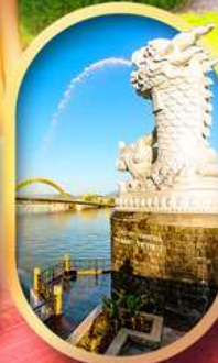
คาร์พดราท้อน