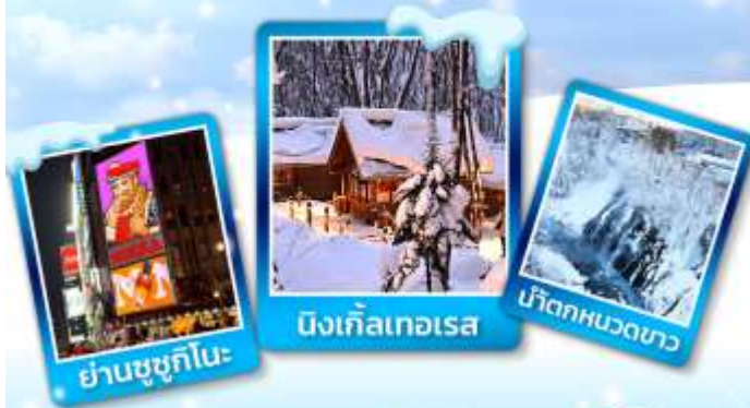
ย่านชูชุกิโนะ