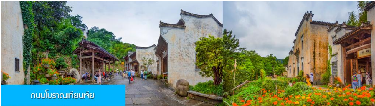
ถนนโบราณเทียนเจีย