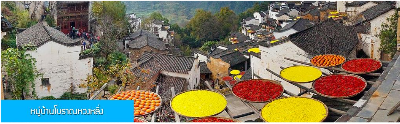
หมู่บ้านโบราณหวงหลิ่ง