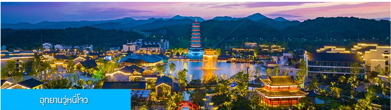
อุทยานวู่หนี่โจว

หลังอาหารนำท่านนั่งกระเช้าลงจากหมู่บ้านหวงหลิ่ง นำท่านขึ้นรถบัสเดินทางสู่อุทยานวู่หนี่โจว