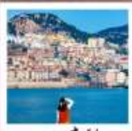
หาดซาโจ่วไฮ่

หอคอยกาลเวศา • ชายหาดจินซา • รูปปั้นปลาวาฬ • ประตูเขินฮันทะเล สวนเหมียนโกซาน • ถนนโบราณเตาหยาง • WEI HAI WINDOW • ถนนฮิวจวิ่เป่า เรือบลูวิส • ย่านฮั่นเสอฝาง • หาดทรายซาโจ่วไฮ่ • ถนนหลงเจียง พิพิธภัณฑ์ที่ว่าการเก่าเยอรมัน • สะพานข้ามเจียว • ถนนจงซาน โบสถ์ St. Emil • หาดโซเบอร์ NO.3 • สวนจงซาน • ป่าด้ากวน QINGDAO HAITIAN CENTER ชั้น81 • ถนนเทียนชางหาดปิ่นใหญ่จันเต่า โรงงานเบียร์ชิงเต่า • ถนนกมตันโก่ตง • ศูนย์เรือใบโอสัมปิท