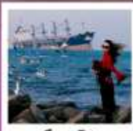
เขื่อนซูวิศ

ทัวร์คุณธรรม ไม่ลงร้านช้อปปิ้ง ไม่ขายออฟชั่น