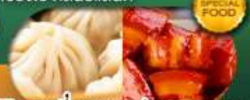
พิเศษ เสี่ยวหลงเป่า หมูตงพอ เดินทาง ม.ค. - มิ.ย. 69