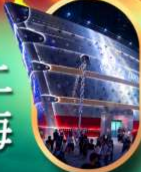
เรือคองคอลลี