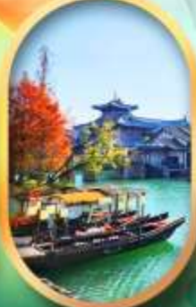
เมืองโบราณผู้หยวน