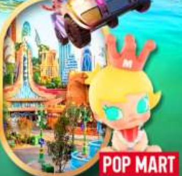
เลือกซื้อทัวร์เสริม เซี่ยงไฮ้ ดิสเนย์แลนด์