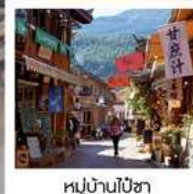
หมู่บ้านไปซา