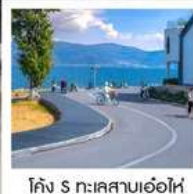
โค้ง S ทะเลสาบเอ๋อไห่

"นั่งรถไฟชมวิวกุหลาบหิมะมังกรหยก" สุดพิเศษ คาเฟ่ YUN DI AN ฟรี!! เครื่องดื่ม ท่านละ 1 แก้ว