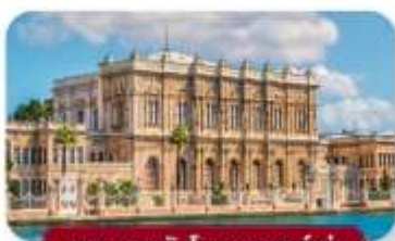
พระราชวังโดลมาบาห์เซ่