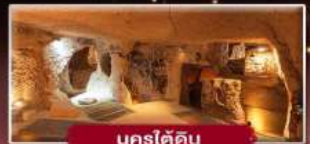
นครใต้ดิน