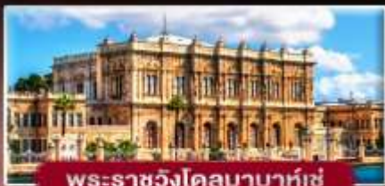
พระราชวังโดลมาบาห์เซ่

พิเศษ..พักดัมปาดาเทีย 2 คืน ฟรี! ไอศกรีมท่านละ 1 SCOOP