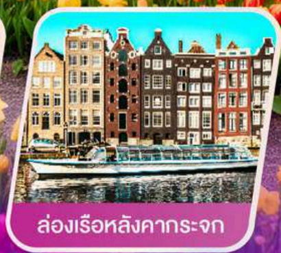
ล่องเรือหลังคากระຈก