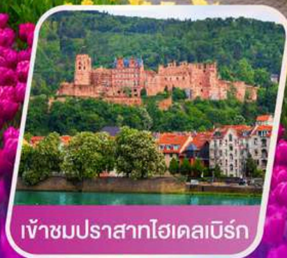
เข้าชมปราสาทไฮเดลเบิร์ก