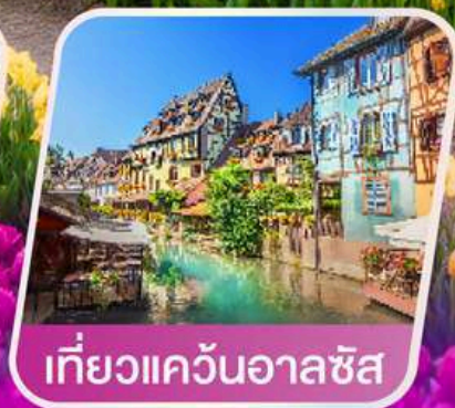
เที่ยวแคว้นอาลซัส