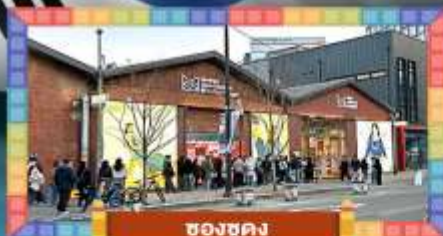
ช้อปปิ้ง