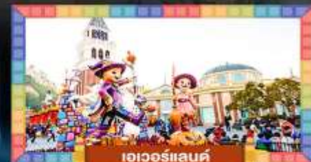
เอเวอร์แลนด์