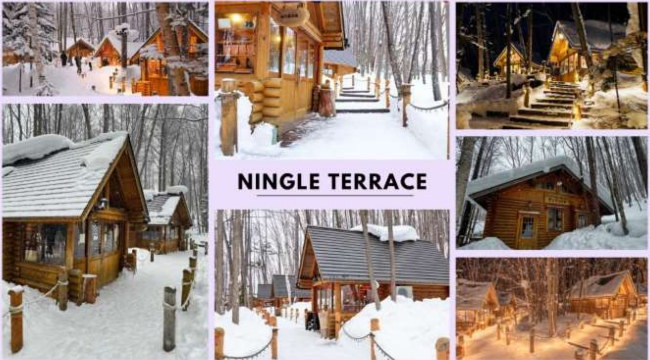
รูปภาพใช้เพื่อประกอบการโฆษณาเท่านั้น

จากนั้นนำท่านสู่ เมืองฟูราโน่ นำท่านสู่ หมู่บ้านเทพนิยายนิงเกิ้ลเทอร์เรส (Ningle Terrace) สัมผัสมนต์เสน่ห์ของ หมู่บ้านไม้เล็ก ๆ ท่ามกลางป่าสน ที่ดูราวกับหลุดออกมาจากเทพนิยาย โดยแต่ละหลังคือร้านอาหารฝีมือแอนด์เมดจาก ศิลปินท้องถิ่น ทั้งเครื่องประดับ เทียนหอม งานไม้ และของที่ระลึกสุดน่ารัก เหมาะสำหรับถ่ายรูป เดินเล่น หรือเลือกซื้อ ของขวัญสุดพิเศษกลับบ้าน อิสระให้ท่านได้เดินเล่น และถ่ายรูปตามอัธยาศัย