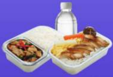
บริการอาหารร้อนบนเครื่อง ขาไป - ขากลับ

10.40 น. ด่านเดินทางถึง สนามบินนานาชาตินิวซีโดเส ประเทศญี่ปุ่น (**เวลาที่ประเทศญี่ปุ่นจะเร็วกว่าประเทศไทย 2 ชม. ควรปรับนาฬิกาของท่านเพื่อสะดวกในการนัดหมาย) หลังผ่านพิธีตรวจคนเข้าเมืองแล้ว นำท่านรับประทานอาหารกลางวัน