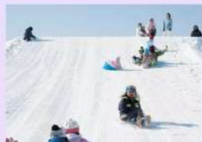
รูปภาพใช้เพื่อประกอบการโฆษณาเท่านั้น