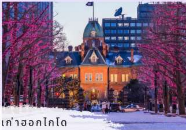
ศาลาว่าการเก่าฮอกไกโด SAPPORO WHITE ILLUMINATION