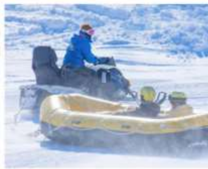
รูปภาพเพื่อประกอบการโฆษณาเท่านั้น