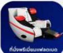
ที่นั่งพรีเมียมฟลัดเบด